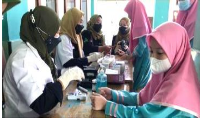
Gambar 5. Pemeriksaan Kesehatan

Kegiatan dilanjutkan dengan tanya jawab dan ditutup dengan post-test dan evaluasi kegiatan. Sebelum acara ditutup oleh guru Pembina, siswa diberikan kuis terkait materi yang diberikan dan yang berhasil menjawab mendapatkan doorprize .