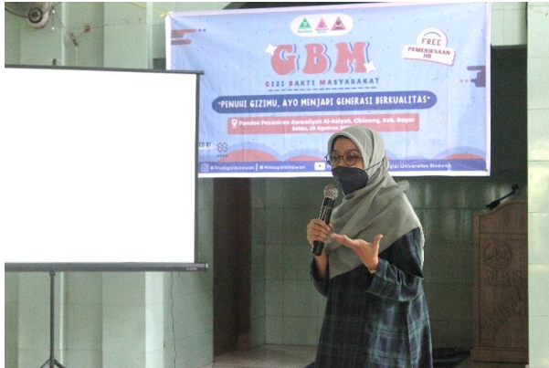
Gambar 3. Penyajian Materi Pertama

pertanyaan dan games-games yang meningkatkan semangat agar materi edukasi dapat masuk dengan baik. Setelah itu peserta diberikan pre-test yang berisi 10 pertanyaan.