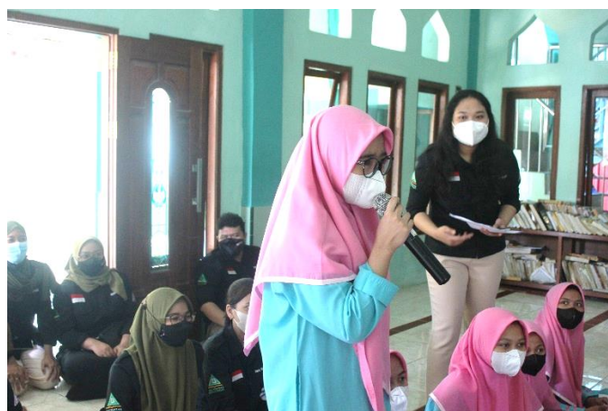
Gambar 4. Tanya Jawab

Materi pertama yang diberikan adalah mengenai “Mengungkap Pentingnya Peran Gizi” selama 30 menit, agar santriwati mengenali penting peran gizi terhadap kesehatan tubuh dan menjadi lebih memperhatikan apa yang dikonsumsi. Kemudian dilanjutkan dengan materi “Pengaruh Menstruasi dan Asupan gizi untuk mencegah Anemia” dan terakhir mengenai “Strategi Meningkatkan Kesadaran Berperilaku Hidup Bersih Sehat” agar santriwati lebih peduli dengan hidup sehat dan bersih mengingat kehidupan asrama di pesantren, hidup bersama dan berbagi dengan orang lain yang dapat mengakibatkan risiko penyakit.