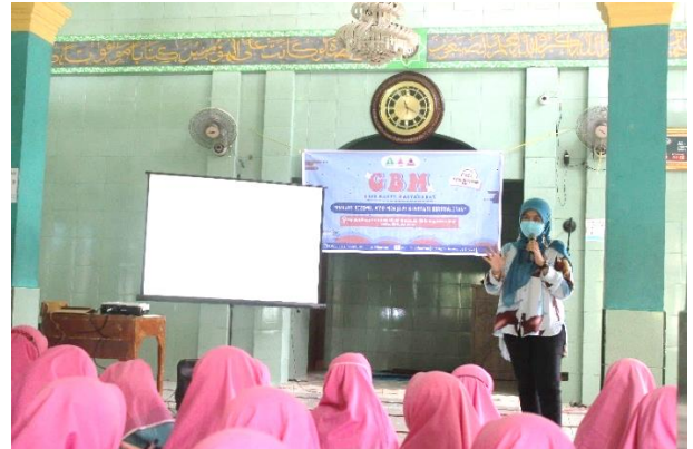
Gambar 3. Penyajian Materi Kedua

Materi pertama yang diberikan adalah mengenai “Mengungkap Pentingnya Peran Gizi” selama 30 menit, agar santriwati mengenali penting peran gizi terhadap kesehatan tubuh dan menjadi lebih memperhatikan apa yang dikonsumsi. Kemudian dilanjutkan dengan materi “Pengaruh Menstruasi dan Asupan gizi untuk mencegah Anemia” dan terakhir mengenai “Strategi Meningkatkan Kesadaran Berperilaku Hidup Bersih Sehat” agar santriwati lebih peduli dengan hidup sehat dan bersih mengingat kehidupan asrama di pesantren, hidup bersama dan berbagi dengan orang lain yang dapat mengakibatkan risiko penyakit.