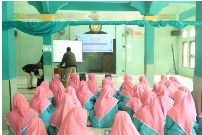
Gambar 2. Persiapan Kegiatan

Kegiatan PkM di Pesantren Awwaliyah Al-Asiyah dilaksanakan pada tanggal 29 Agustus 2021 yang dimulai pukul 09.00 WIB. Kegiatan ini dibuka oleh Ka Prodi Gizi sekaligus salah satu pemateri dan oleh Perwakilan Pondok Pesantren Awwaliyah Al-Asiyah. Pada awal kegiatan peserta masih malu-malu namun oleh MC diberikan